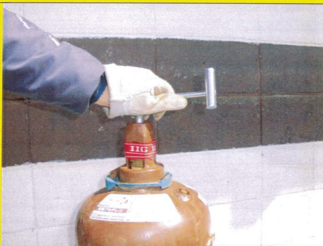
左手でハンドルと容器を押 さえます