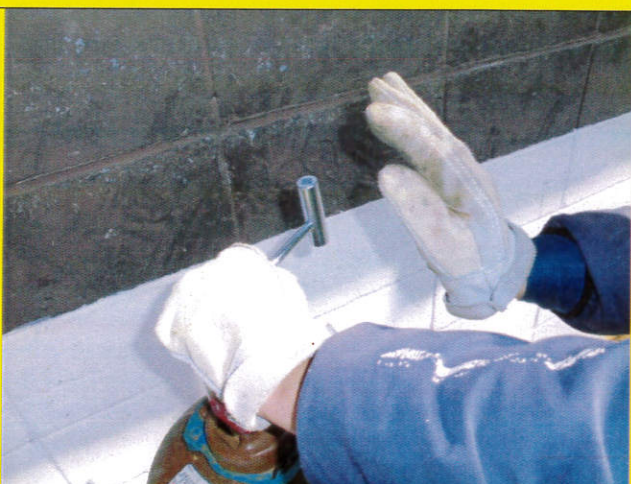
右手でトントンと押してゆけばバルブ開 (閉止の際は右手で取手を持ち、手前側 へ引く方向へ・取手があるので楽々!)

溶接女子に最適! 手のひらの小さい人、 力の弱い人でも楽々ボンベバルブを開閉! 近日発売 ¥800 (税別)